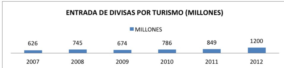
Gráfico 2.- Entrada de divisas por turismo